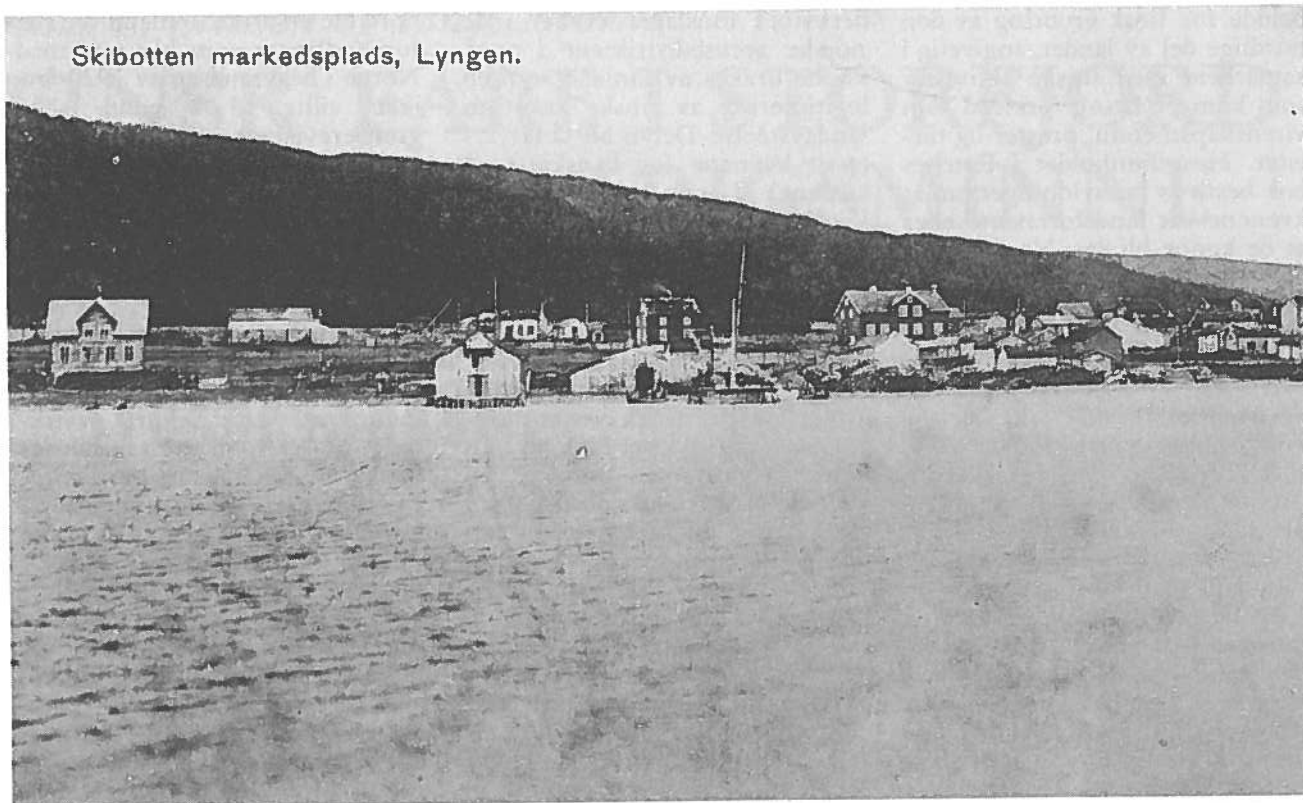
Skibotten markedsplads, Lyngen.

kvensk organisering, ble sett på med den største mistenksomhet. En kjent kven i Skibotn anmeldte i 1934 en finsk roman i avisa Tromsø. Anmeldelsen sluttet med en oppfordring til finskspråklige om å lese boka. Fra militært hold ble det reagert med en gang. Redaktøren i Tromsø, som for øvrig var en ivrig fornorskingstilhenger, ble bedt om å la være å ta inn slike anmeldelser for framtida. Det ble vist til at myndighetene brukte mye arbeid og store penger på å fremme norskheten i grensestrøkene. Det ville da vært av betydning å få støtte av pressen, «ikke bare ved positivt byggende artikler i nasjonal retning, men også ved å stenge bladenes spalter for finsk reklame». Redaktøren lovet å rette seg etter det. Bokanmelderen fra Skibotn merket kanskje ikke så mye til konsekvensene av sitt litterære engasjement. Men han ble satt under overvåking, og all post til og fra ham ble åpnet av postmesteren i Tromsø. For øvrig ble han holdt øye med av forsvarrets etterretningsmann i hjembygda.