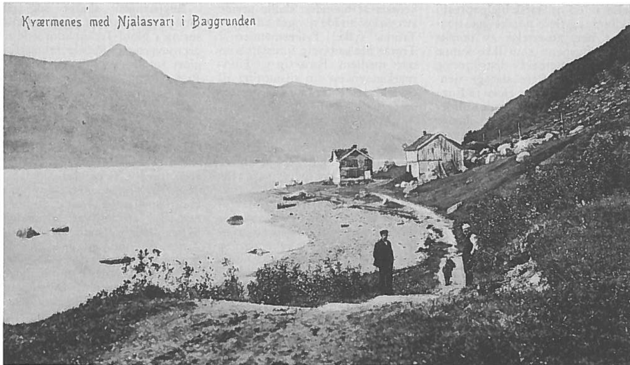
Kvæzrmenes med Njalasvari i Baggrunden

ligskogen ble det opprettet en grense- og tollstasjon. En turiststasjon ble også anlagt der. En streng passkontroll ble innført. Også reindriftssamene ble avkrevd pass. Troms fylke falt i 1936 inn under Finnmarksnevndens virkeområde. Fylkesmannen i Troms ble medlem av nevnden.