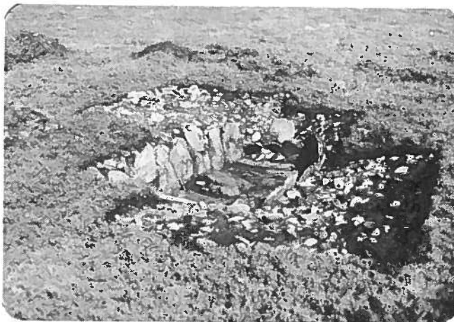
Hellekister avdekket på Nymoen, Lauksletta, august 1990.

Avdekkinga av hellekista på Nymoen er interessant, folk fra museet er takknemlig for hjelp fra folk om hva dette er for noe, men nå skal alle data bearbejdes, og det er vel ikke så usannsynlig at man vil komme fram med en teori om hva dette er for noe.