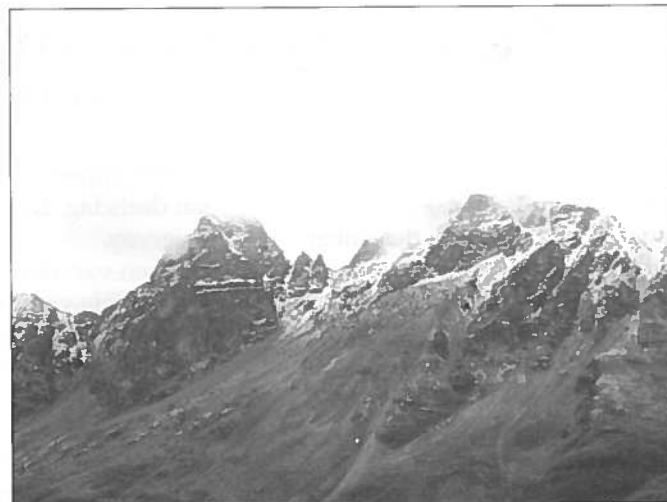
Dei to trolla står enno der ved sida av Horsnestinden.

På slike samankomstar fikk vi ofte høre mange histori- er, både skumle og morsomme. Bestefar var kjent som ein stor forteljar - med hulder-, skrømt- og draughistori- er i hopetall. Radio var ikkje særlig vanlig på bygdene den gongen, men vi hadde stor underhaldning i det folk kunne fortelje. Både far og mor var dyktige til det. Vi fikk høre om dei store ostane som alltid kom tril- lande nedover fjellsida julenatta, om sola som dansa av glede over fjella grytidlig påskemorgonen, om forfe- drane som kom vandrande fra Finland og fra andre strøk av landet og slo seg til her, om kjempen under Kjempesteinen oppe i dalen - og om dei to trolla som vi kunne sjå ved sida av Horsnestinden, som var på veg for å plyndre nede i bygdene langs fjorden, men som blei til stein då sola rann. Aller verst var det kanskje å høre om Bøla ( av det finske ordet pølatykset ), for han holdt enno til i skogen oppe i dalen og var svær til å hente ungar som ståka og ropte ute etter at det var blitt mørkt om kvelden!