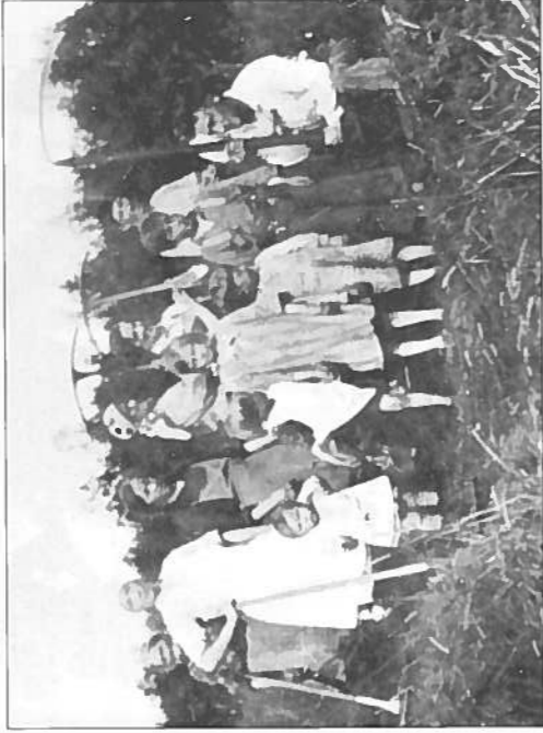
Storfamilien er i gang med høyonna. Forfattern er nr. 3 fra venstre.