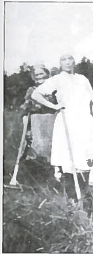
Storfamilien er i ga

Mors dag var av hus og fam med lillebror etter krigen. Så sauer og høns. også gått i syla likte ho veldig trivdes best nå Dei første vint det så vidt - og så fikk han fas