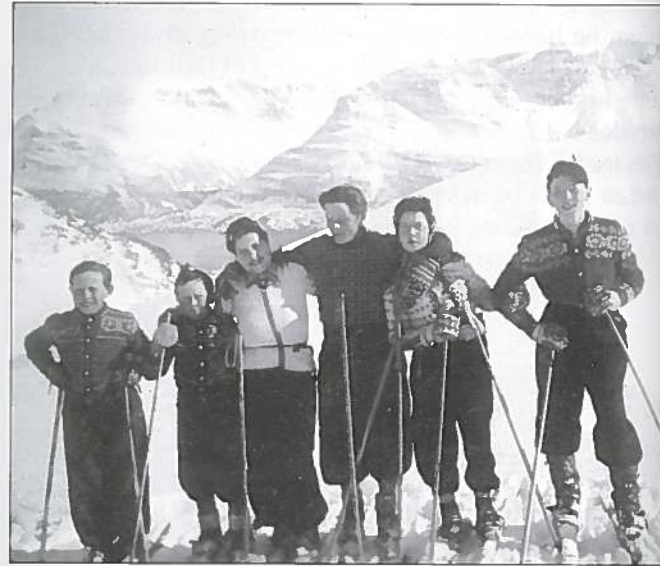
Barn og ungdom fra Ellevoll på tur over Båri. Fjorden og Horsnesfjellet i bakgrunnen.

blem - det braut vi oss av passende busker eller greiner i vedskjulet. Først under krigen blei det meir vanlig med kjøpstavar og bindingar. Skismurning klarte vi oss utan, men far varma opp tjære på komfyren og smurte under skiene våre ved sesongstart, og etter noen dagar var dei glatte og fine for allslags føre.