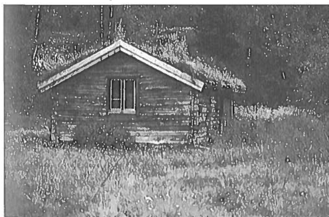
Den gamle bua på Lullevollen i Skibotn-dalen.