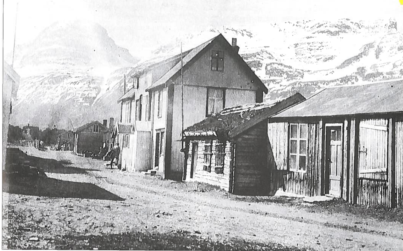
Bygdeveien på Skibotn med hotellet og markedsstuene.