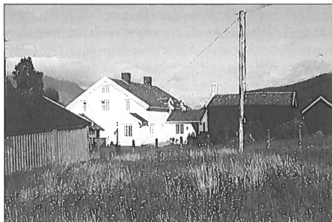
Rasch-gården som den står i dag med det gamle posthuset, våningshuset og stabburet.

Foto: Fylkeskonservatoren i Troms, I.H. 1985