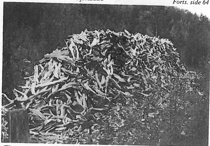
Tjæreved — en sikker arbeidsplass