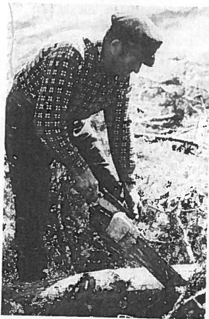
Fremdeles er skogen en god arbeidsgiver —

Helt fram til en 20-30 år siden tjente jo favneveden de samme formål som elektrisiteten gjør nå for tiden. På samme måte som idag var det ressurser innen fjorden som ble eksportert for å tilfredsstille andre områders energibehov. Men den gang betydde dette arbeidsplasser for folk i fjorden, nesten alle menn var mer eller mindre sysselsatt med å drive fram favneved for salg. Idag derimot, er situasjonen en helt annen. Fremdeles — og kanskje